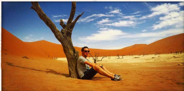
25 REASONS WHY YOU SHOULD TRAVEL TO NAMIBIA